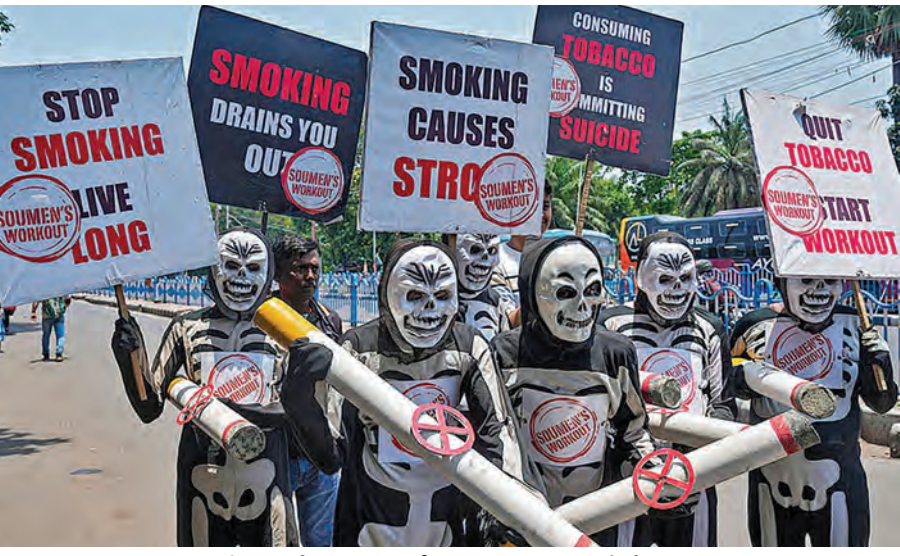
అదివారం కోల్కతాలో పాగాకు వ్యతిరేక దినం సందర్భంగా రా్యలీలో పాల్గొన్న ప్రజలు

>>> తెలిపారు. సకాలంలో సాగునీటిని విడుదల చేయడంతో పాటు రైతు పండించిన పంటను కొనుగోలు చేస్తున్నామని అన్నారు. ఎంపీ ఎమ్మెల్యేలు మాట్లాడుతూ గత ప్రభుత్వంలా కాకుండా కూటమి ప్రభుత్వంలో సాగునీటి ప్రాజెక్టుల నిర్వహణకు, రైతులకు సాగునీటి పెట్టడి చేస్తూ నిధులు విడుదల చేస్తున్న ప్రభుత్వంపై చంద్రబాబుకు ప్రత్యక్షతలు తెలిపేశారు. ఈకార్యక్రమంలో ఇరిగేషన్ అధికారులు క్రొజెక్ట్ కమిటీ సభ్యులు పాల్గొన్నారు.